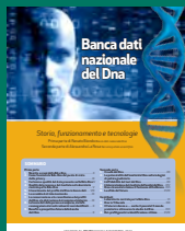
BANCA DATI NAZIONALE DEL DNA Novembre 2016