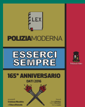
COMPENDIO DATI Aprile 2017